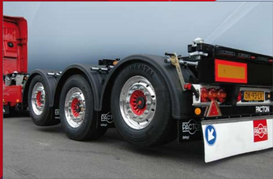
Uitvoering met 2 aslfien.