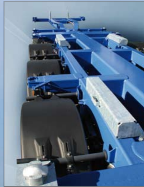
2 x 2 opvulblokken.