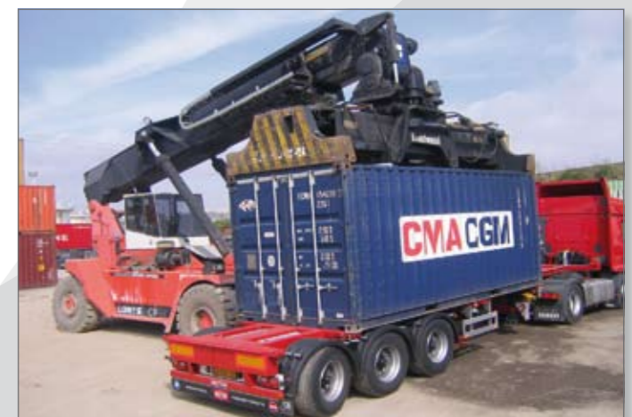
20ft centraal geplaatst.