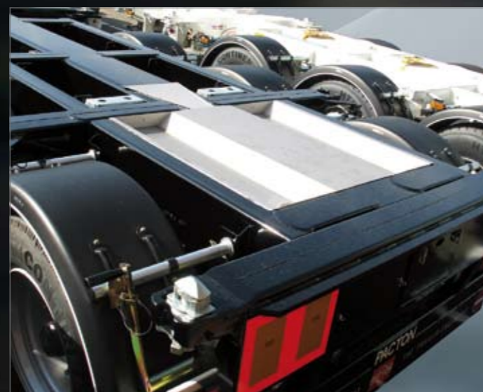
Lekbakken voor tankcontaineruitvoering.

De Flex-XL is onderdeel van de Pacton Container X-press serie, die bestaat uit vaste opleggers voor 20ft, 30ft, 40ft en 45ft containers. De Container X-Press serie blinkt uit in duurzaamheid, gebruiksvriendelijkheid en stabiliteit. Voor elk segment zijn specifieke opleggers leverbaar, zoals lichtgewicht opleggers voor het shortsea 45ft vervoer, versterkte uitvoeringen voor gebruik op inlandterminals en versies voor het transport van flats tot en met 45ft.