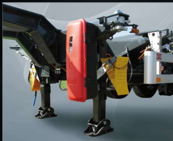
ADR uitvoering met brandblusser en wielgегgen.