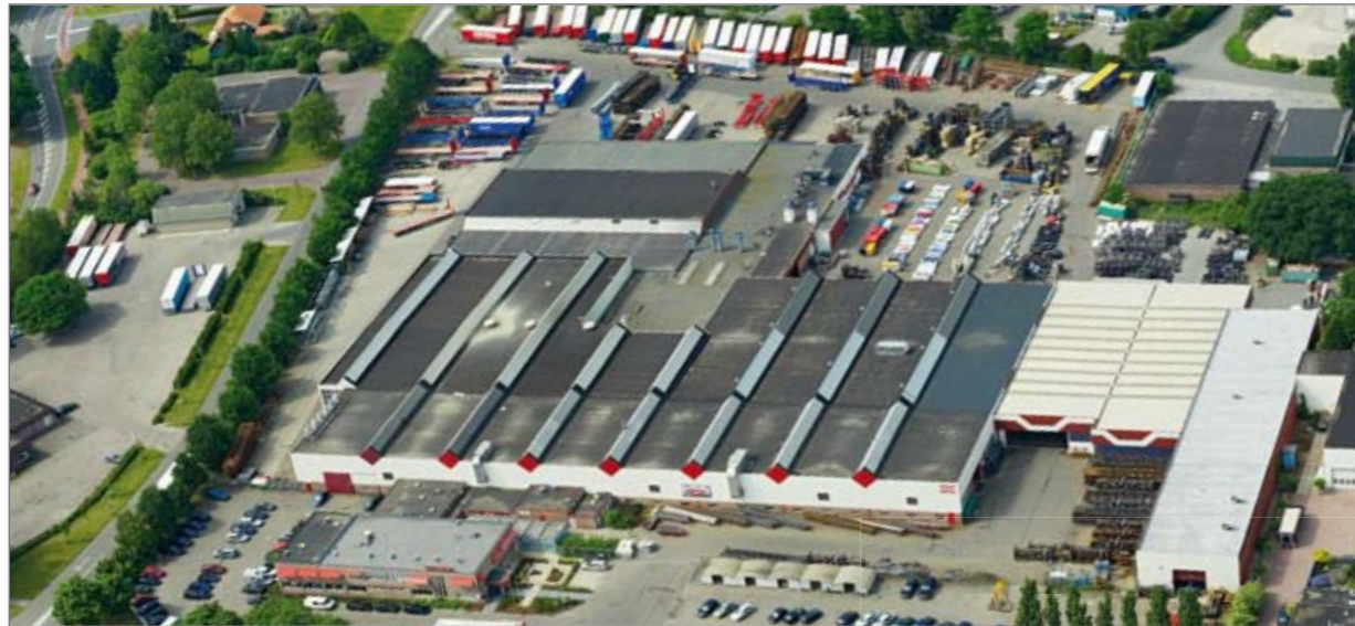
Pacton hoofdvestiging te Ommen