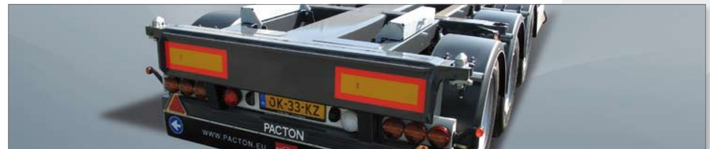
Uitvoering met 3 dubbele Hella achterlampen.