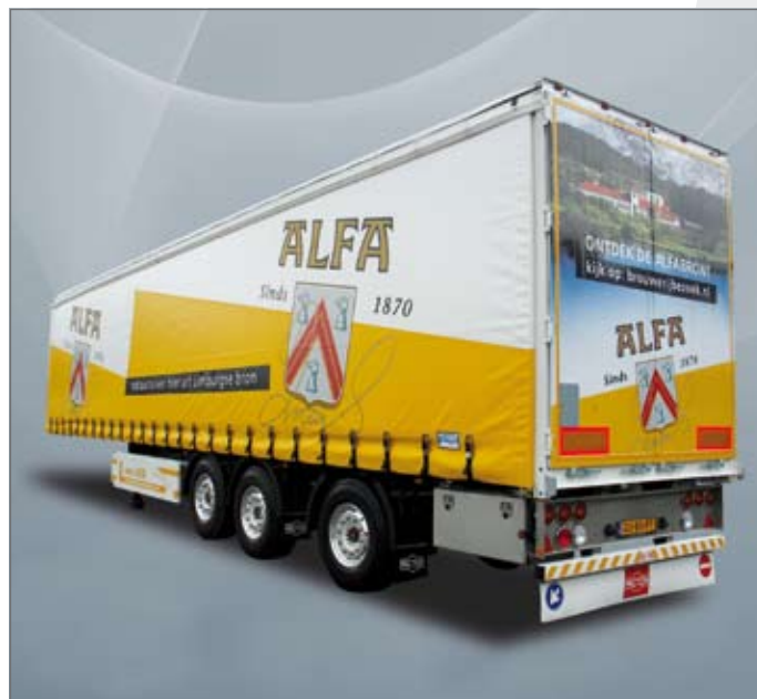
Achterste as stang-gestuurd.

De belangrijkste laad- en losfuncties (besturing van de assen, open- en dichtschuiven van de schuifzeilen, bediening van het hefdak en bediening van het platform voor de vorkheftruck) kunnen met één afstandsbediening