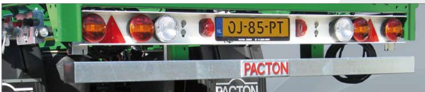
Deense lichtbak met gegalvaniseerde bumper.

radiografisch worden geactiveerd, voor optimale veiligheid en gebruiksvriendelijkheid voor de chauffeur. Een speciale uitvoering van dit type kan, inclusief lading, met een totaal gewicht van 52 ton door middel van een kraan op de trein gezet worden.