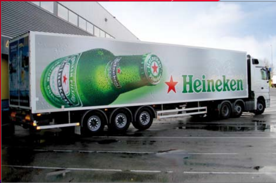
Heineken laad- en lossysteem voorzien van kettingbanen.