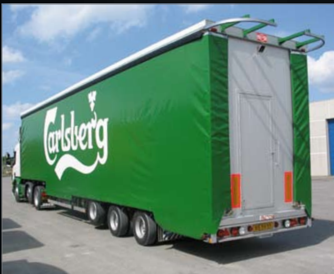
In achteroverbouw hydraulisch platform voor vorkheftruck.