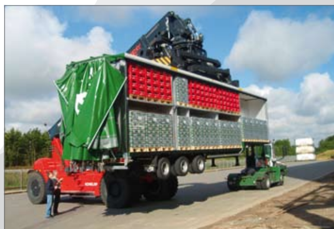
De trailer van in totaal 52 ton wordt d.m.v. een kraan op een trein gezet.