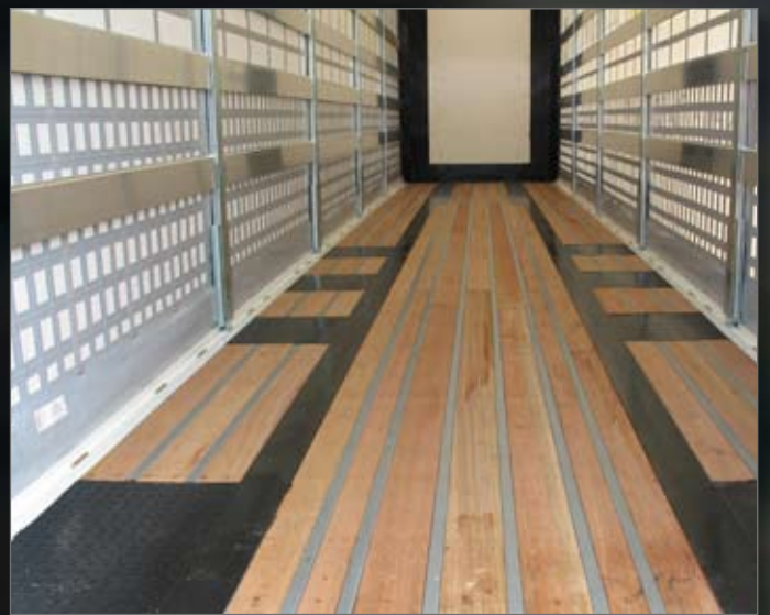
Anti-diefstal zeilen, extra veel laadruimte door lage koppelingshoogte