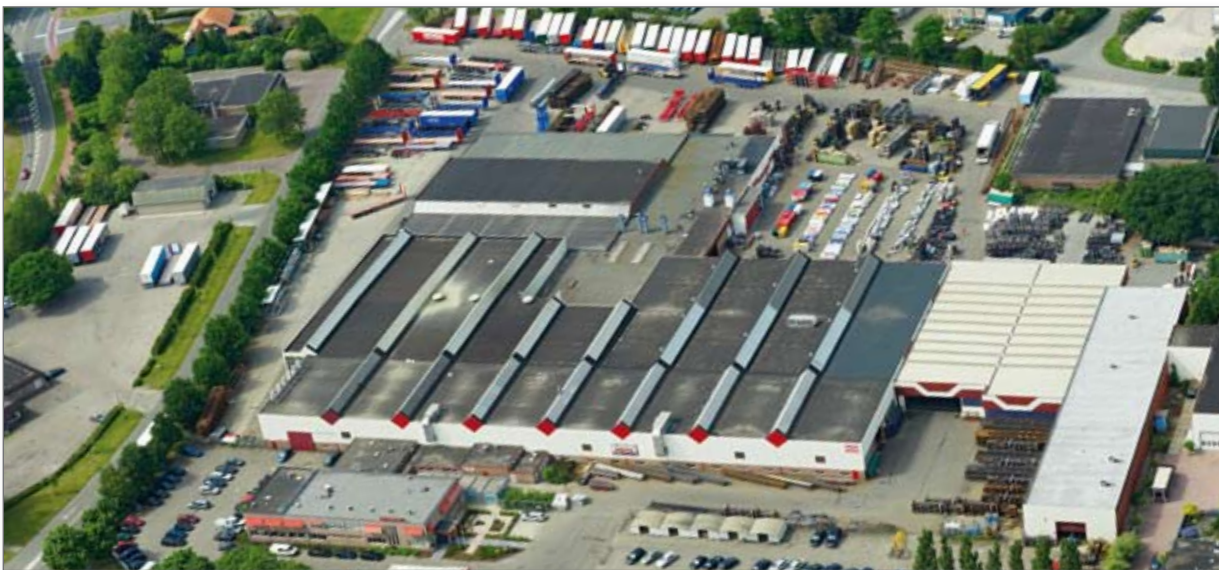
Pacton hoofdvestiging te Ommen