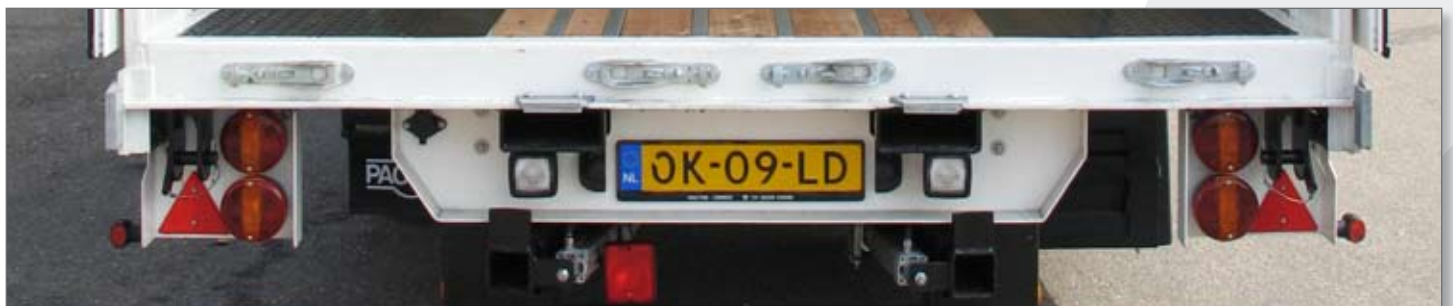
Achterzijde met aansluiting voor meeneemheftruck