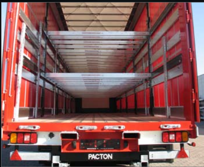
Mega X-press uitgevoerd met hefdak en driedubbele laadvloer