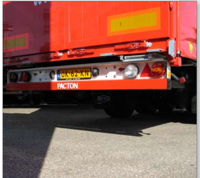
Extra lage lichtbak