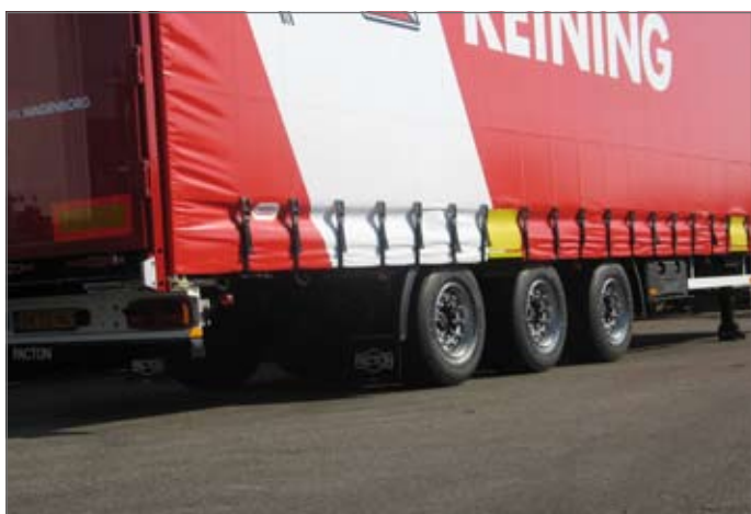
Huckepack uitvoering met Ladungssicherung