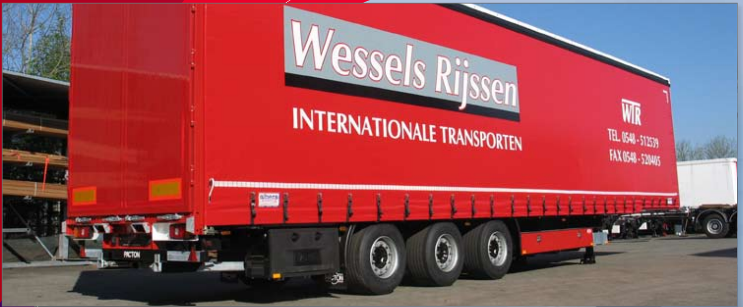
Strakke montage, kist in kleur gespoten en aansluiting voor meeneemheftruck