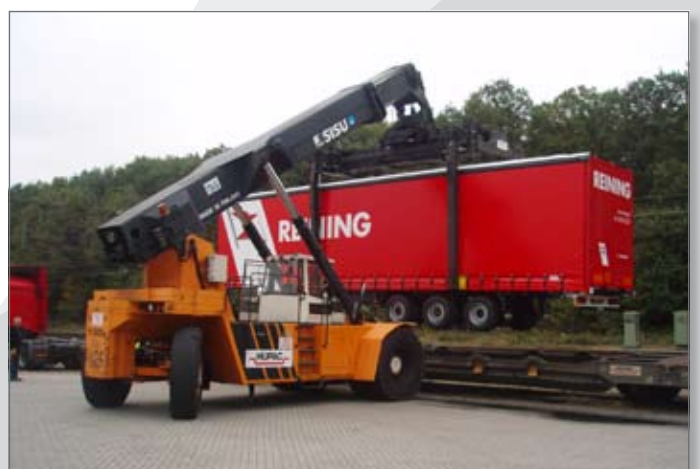
Mega X-press wordt op de trein gezet